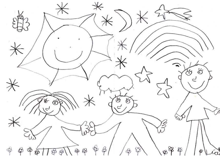
Lia Romero Valle, 3ºB Infantil