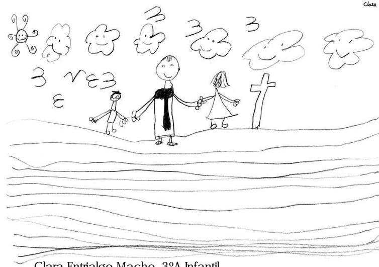
Clara Entrialgo Macho, 3ªA Infantil

Contamos con tu entusiasmo y colaboración en todas las actividades programadas